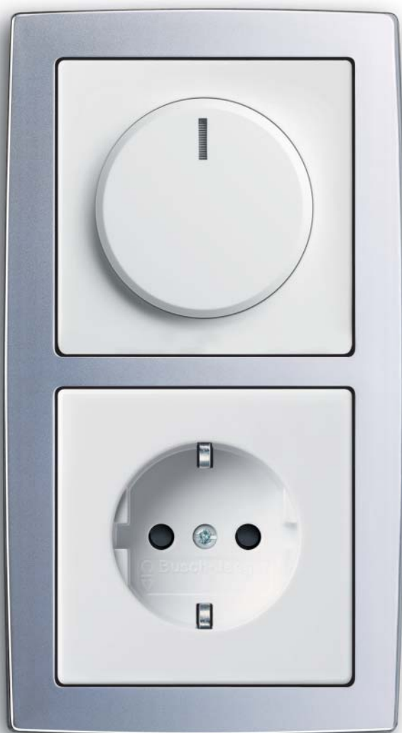
2-voudige combinatie dimmer / wandcontactdoos met geïntegreerde verhoogde aanraakbeveiliging (kinderveilig). Kleur: davos (studiowit / mat-chroom).